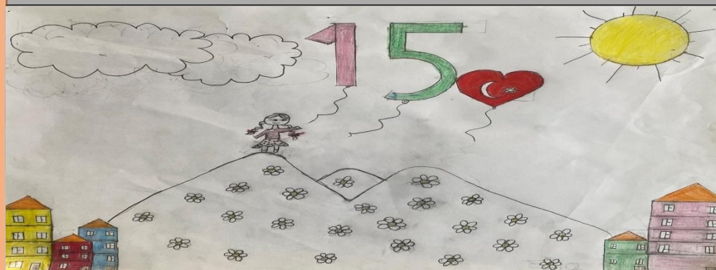
ESMA BOZBAY - 4/A SINIFI