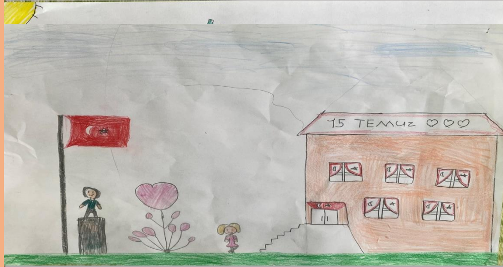
NİSANUR TÜRKMEN – 4/A SINIFI

Komutanından aldığı emirle, Özel Kuvvetler Komutanlığı'nı işgal etmeye gelen darbeci general Semih Terzi'yi gözünü kırpmadan öldüren Ömer Halis Demir, 17 kurşunla vatan toprağına düştü.