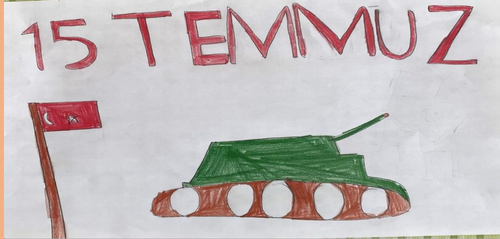
NİHAT EFE COŞKUN 4/A